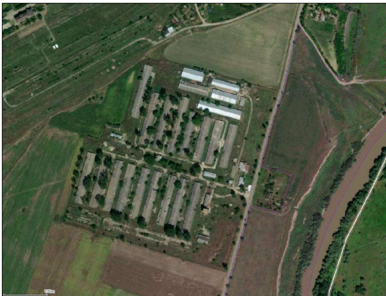
Plan situație existentă

Planul de situație cât și planurile detaliate ale proiectului sunt atașate prezentei documentații.