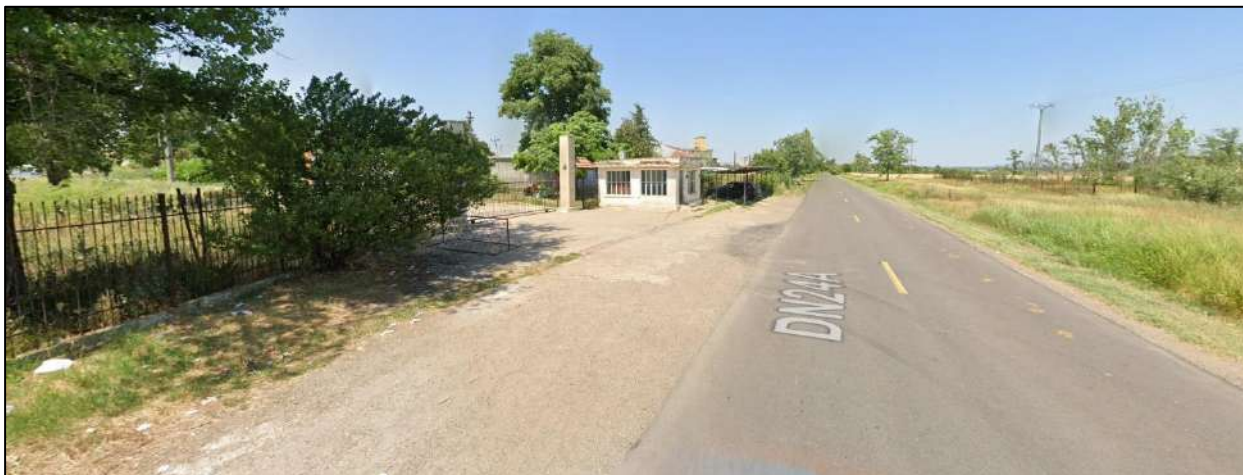
Acces auto pe parcela - existent si păstrat