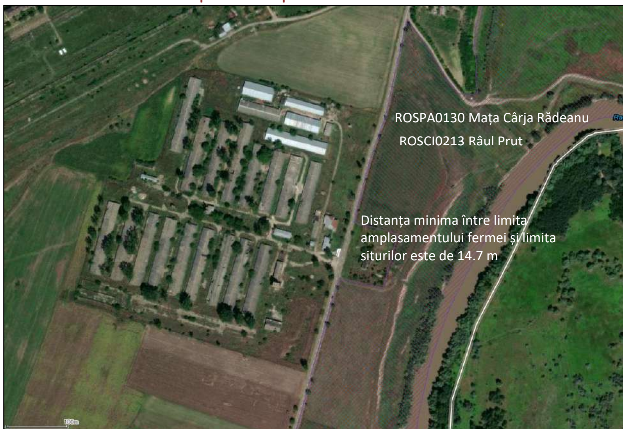
Amplasarea in raport cu siturile Natura 2000 - detaliu