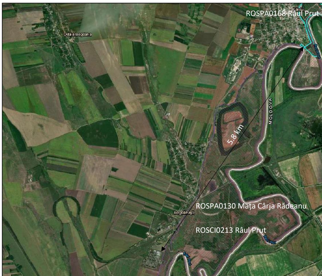
Amplasarea in raport cu siturile Natura 2000