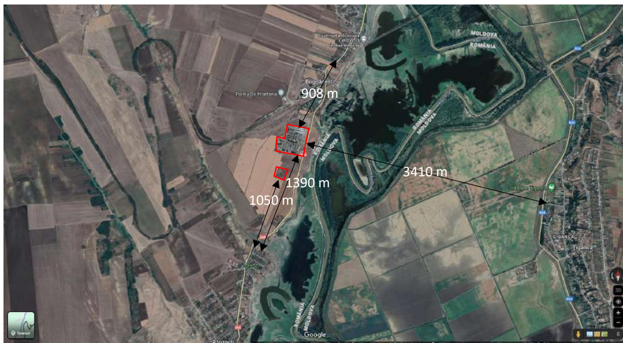
Distanțe față de zonele locuite