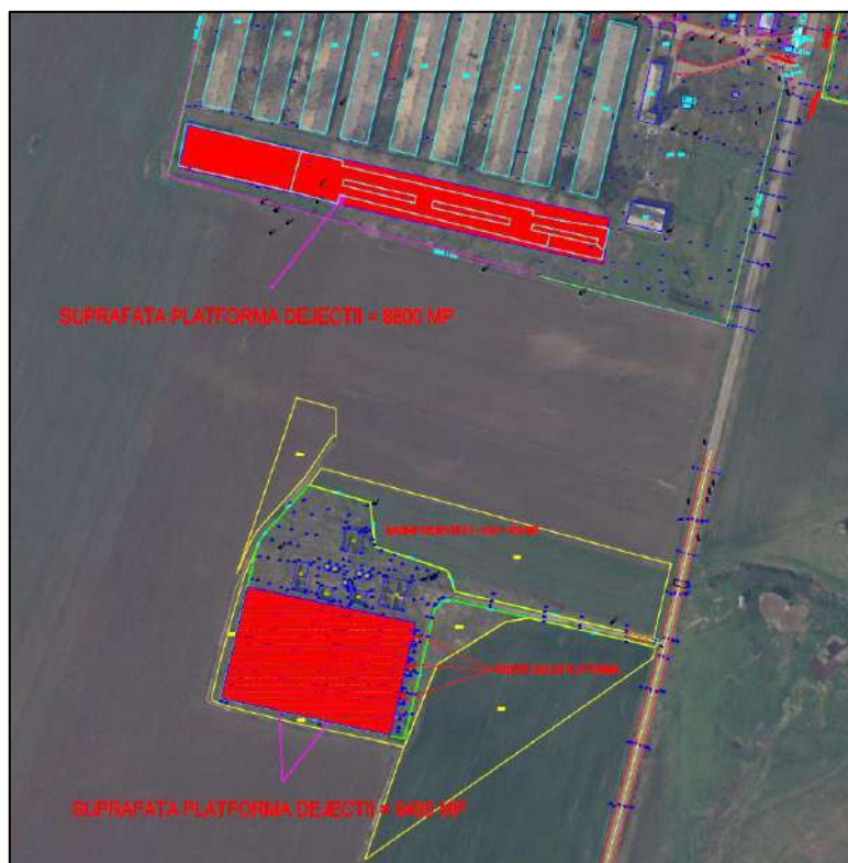
Amplasarea celor 2 platforme pentru colectarea deiețiilor