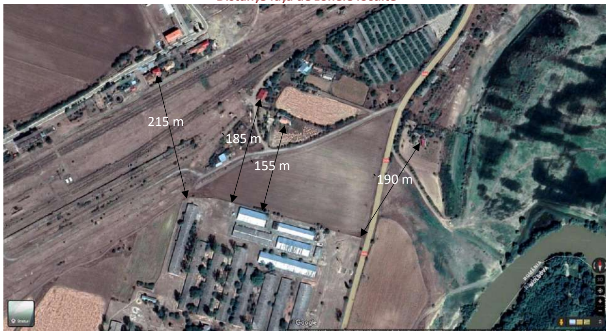
Detaliu privind vecinătățile relevante