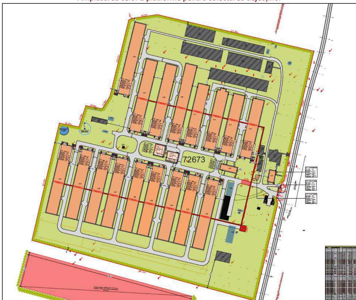
Plan situație propusă